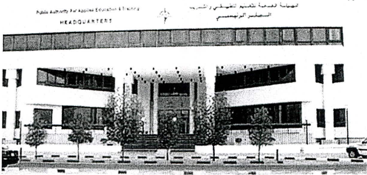
الهيئة العامة للتعليم التطبيقي والتدريب